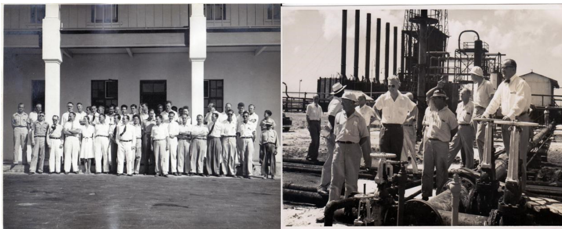
Empleadonan di Refineria Eagle cu a compra un avion Spitfire

E ta asina ilustrativo di e esfuersonan internacional di guerra pa Aruba, pa paga un fabricante Britanico pa suministra un avion Spitfire pa e ehercito di guerra Ingles, pa wordo pilotea pa un piloto di Fuerza Armada Frances. Anteriormente, durante e Di Dos Guerra Mundial mas di cien cuidad y organisacion rond mundo a duna fondo na e gobierno Britanico pa compra avion spitfire, cual tabata wordo yama "Avion di Presentacion". E empleadonan di Eagle a duna fondo pa compra uno. E prijs di produccion tabata $12,500.00. "Aruba", serial No. AD210 a wordo traha dia 9 di september 1941 na e fabrica di avion, Castle Bromwick na Birmingham, Inglatera. El a wordo entrega na e ehercito di guerra, No. 452 di RAAF (Royal Australian Air Force) dia 1 di october 1941, saliendo for di RAF Kently y despues cambiando pa RAF Andreas na e isla di Man. E avion aki a wordo pilotea pa un piloto Frances, Sargento Chef Gaston Danielo, alias Fernand. Gaston a nace dia 13 di juni 1919 na Vannes, Morbihan, Francia.